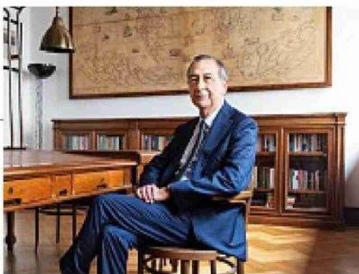
Beppe Sala, 68 anni il 28 maggio, sindaco di Milano dal 21 giugno 2016. Qui al Corriere in Sala Albertini

«IL RIMPIANTO È NON AVER ESERCITATO PIÙ PRESSIONE VERSO L'ALTO E NON AVER COMUNICATO MEGLIO VERSO LA BASE. VORREI CONTINUARE IN POLITICA, MA RESTO UN UOMO DEL FARE. DO IL MEGLIO SOLO SE POSSO OPERARE»