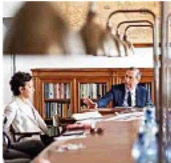
Fermata San Babila, in pieno centro. Sotto il sindaco Sala in Sala Albertini con gli autori dell'inchiesta su Milano riuniti per l'intervista finale